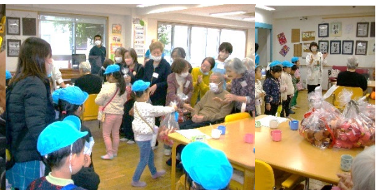
保育園児からのプレゼント

フロア内では機能訓練を受けられたり、皆様ご自由に過ごされています。併設の保育園の子供たちとの交流も復活してきております。就学前の子供たちに癒されます。