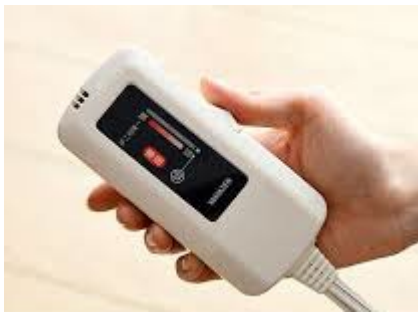
電気毛布は低い温度で使用し、寝る前に電源を消しましょう。

温かい暖房器具ですが「低温やけど」を起こしやすいため、使い方に気を付けましょう。