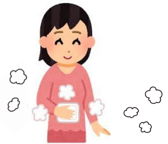
「貼るカイロ」は服の上から貼りましょう。