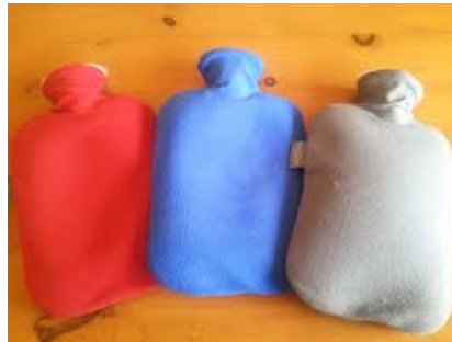
湯たんぽは袋に入れ、さらにタオルで包みましょう。